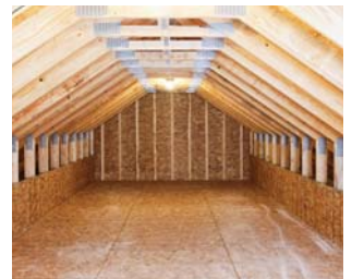
OSB-plader. Anvendt til tag og vægkonstruktion.